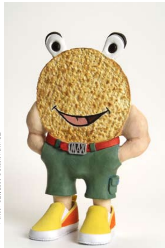
Max de Matze, 2006 © Studio Ram Katzir