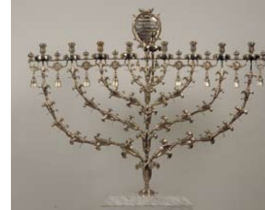
Chanoekia, Pieter Robol II, zilver, Amsterdam, 1753. Bruikleen NIHS, Amsterdam