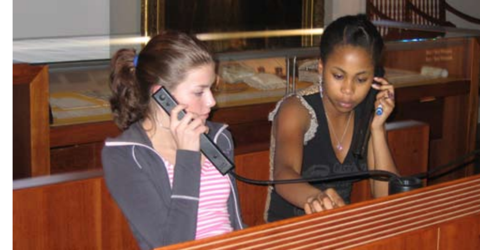
Leerlingen tijdens het programma Joods?! in de Grote Synagoge