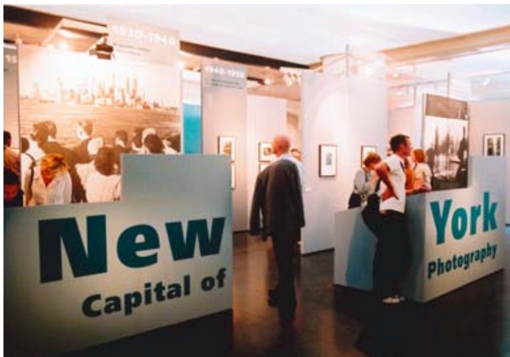
Bezoekers op de tentoonstelling New York: Capital of Photography.

in deze discussie te verdiepen om ervan te kunnen genieten.'