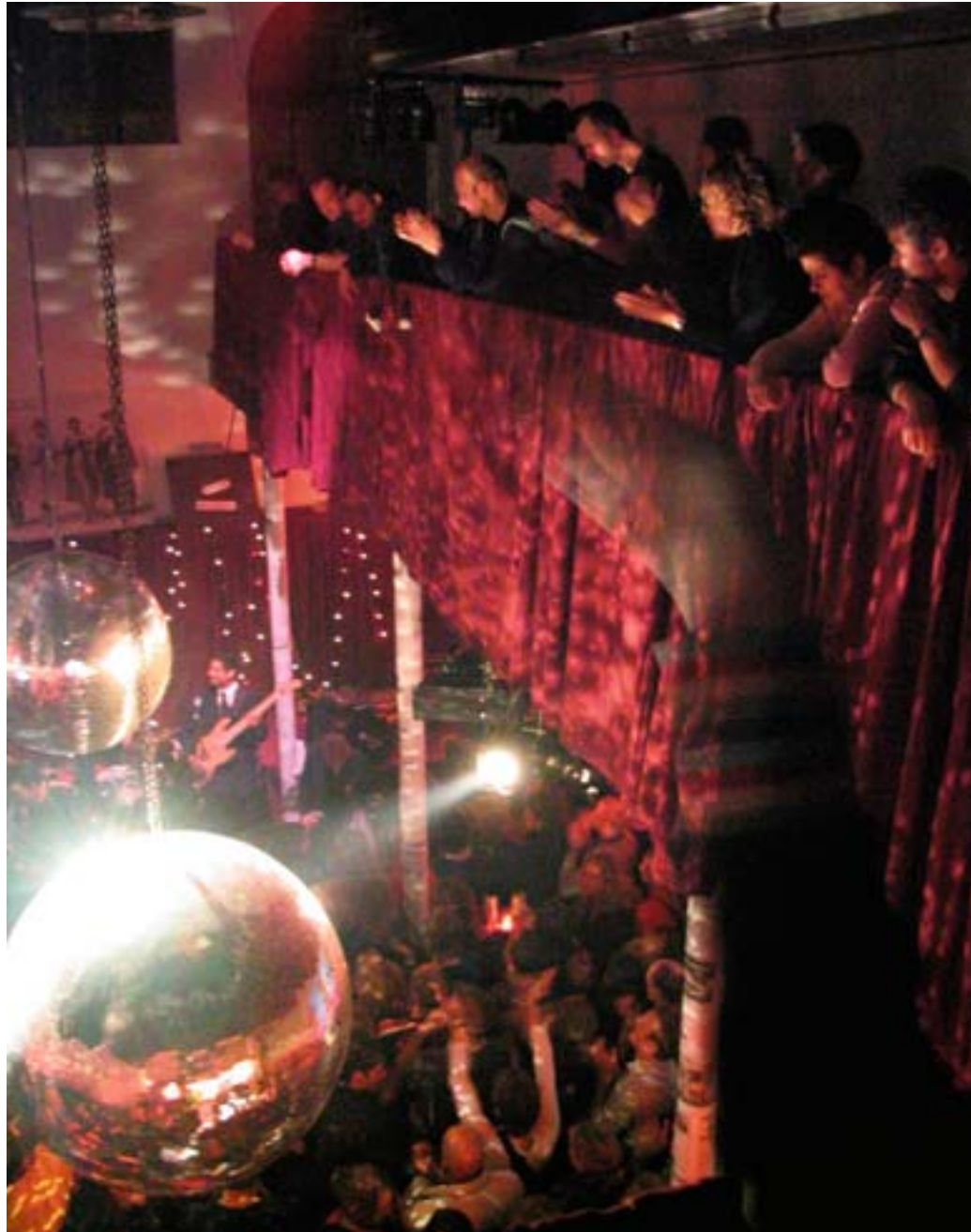
Een dansende menigte in het Museumcafé tijdens de Museumnacht.