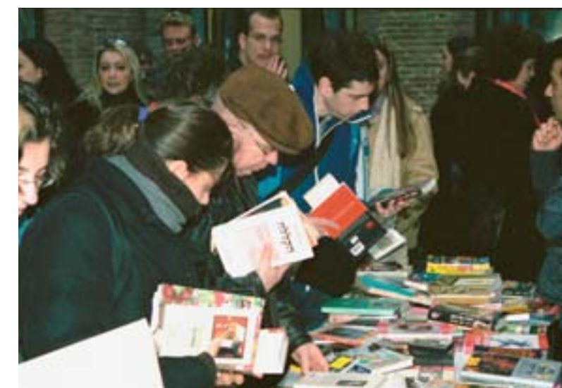
Grote drukte tijdens de Hebreeuwse boekenmarkt 'Shookbook' op 21 december.