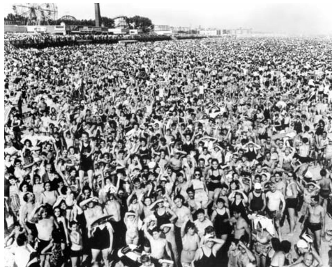
Weegee (Arthur Fellig), Menigte op Coney Island, temperatuur 31,7°C ... Zij kwamen vroeg en bleven tot laat, 22 juli 1940. Ontwikkelgelatinezilverdruk. International Center of Photography, New York. Gift of Wilma Wilcox, 1993.