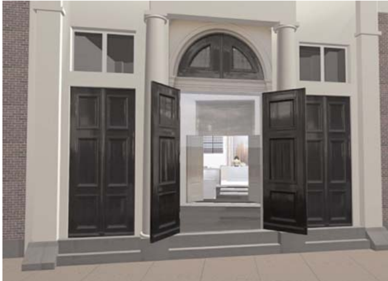
'Het JHM opent zich naar buiten': vanaf de Nieuwe Amstelstraat kunnen voorbijgangers binnenkort door een glazen wand in de Grote Synagoge kijken. Computer rendering van het ontwerp van DJO (Donald Janssen Ontwerpers) voor de vernieuwde Grote Synagoge, die november 2004 geopend zal worden.