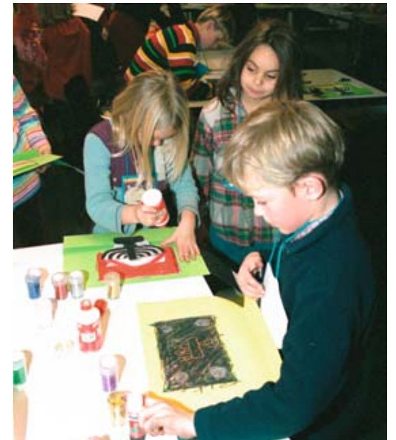
Knutselende bezoektjes tijdens het kinderevenement 'Spelen met licht!'