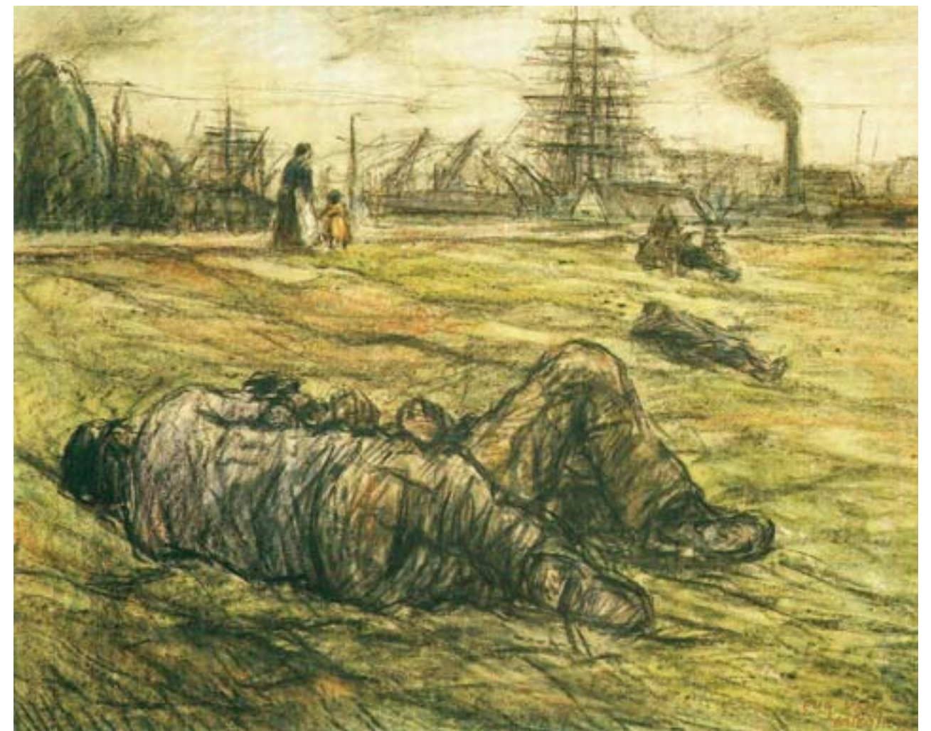
Eugeen van Mieghem, Rustend op de Scheldt dijk, pastel en houtskool, 1912. Collectie Museum Plantin Moretus/ Stedelijk Prentenkabinet, Antwerpen: collectie Prentenkabinet.

cafétaferelen getoond, evenals documentair materiaal met betrekking tot de Red Star Line zoals foto's en ansichtkaarten, affiches, dienstregelingen en reisvoorwaarden. Het model van het stoomschip Belgenland trok de aandacht van vele bezoekers en erg populair was de aansprekende documentaire over Ellis Island Island of Hope, Island of Tears (Charles Guggenheim, 1990, 28 min.). De begeleidende teksten en enkele tekeningen en schilderijen waren opgenomen in een brochure. Van Mieghems gehele oeuvre – waaronder ook werk dat het lijden van de Eerste Wereldoorlog als centraal thema heeft – was in boekvorm in de Museumshop te koop.