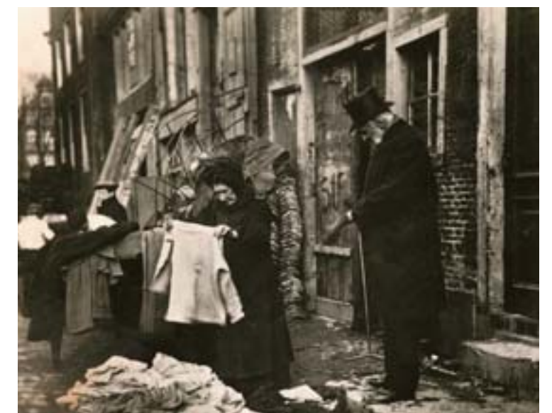
De verkoop van oude kleren op zondagochtend in de Amsterdamse Jodenbuurt, ca. 1910.

Er werden zeventig televisieprogramma's op video opgenomen. De muziekcollectie werd uitgebreid met ruim veertig cd's. Deze video's en cd's kunnen in de mediatheek bekeken of beluisterd worden.