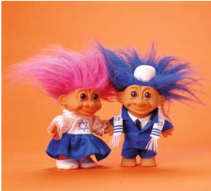
'Joodse trollen' sierden de voorkant van de Junioragenda.

speelde de acht man sterke band 'New Cool Collective' muziek uit de Nieuwe Wereld. De Museumnacht werd door ruim 3000, voornamelijk jonge belangstellenden bezocht.