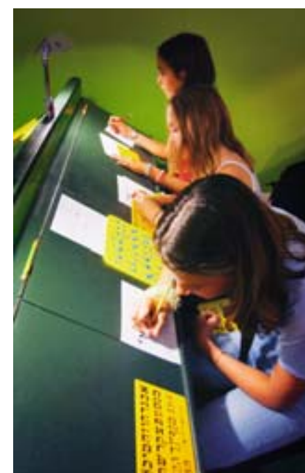
Hebreeuwse letters schrijven tijdens de Plantagedag 2003.