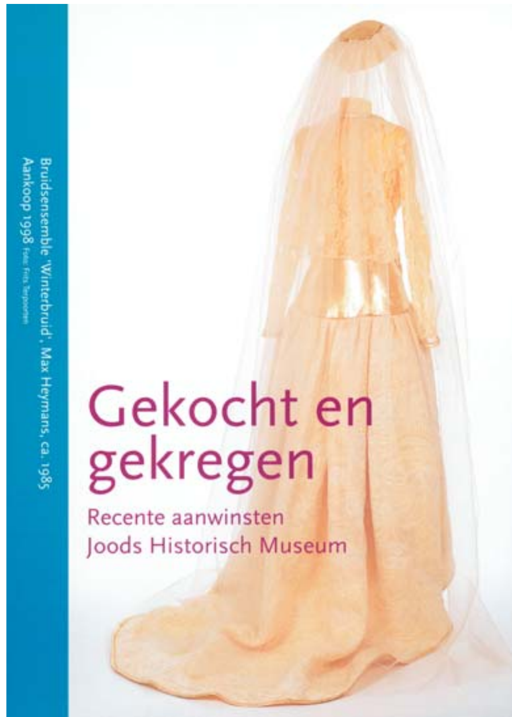
De uitnodiging van Gekocht en gekregen toonde het bruidsensemble 'Winterbruid' van Max Heymans.