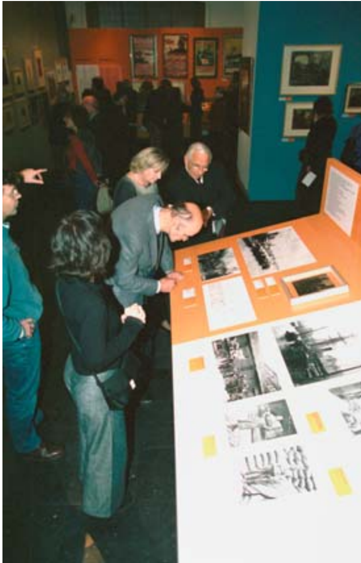
Bezoekers tijdens de opening van Naar de Nieuwe Wereld. De landverhuizers van Eugeen van Mieghem .

Naar de Nieuwe Wereld. De landverhuizers van Eugeen van Mieghem (1875-1930) 24 oktober 2003 tot en met 22 februari 2004 Projectleider: Ischa Mulder Ruimtelijke Vormgeving: ROO / Monique Rietbroek Grafische vormgeving: M/V Marit van der Meer