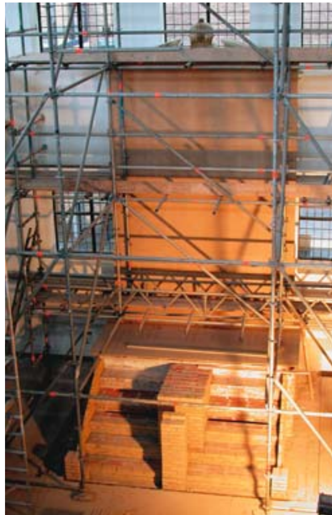
De eerste stap van de vernieuwing is gezet met de verbouwing van de Grote Synagoge.