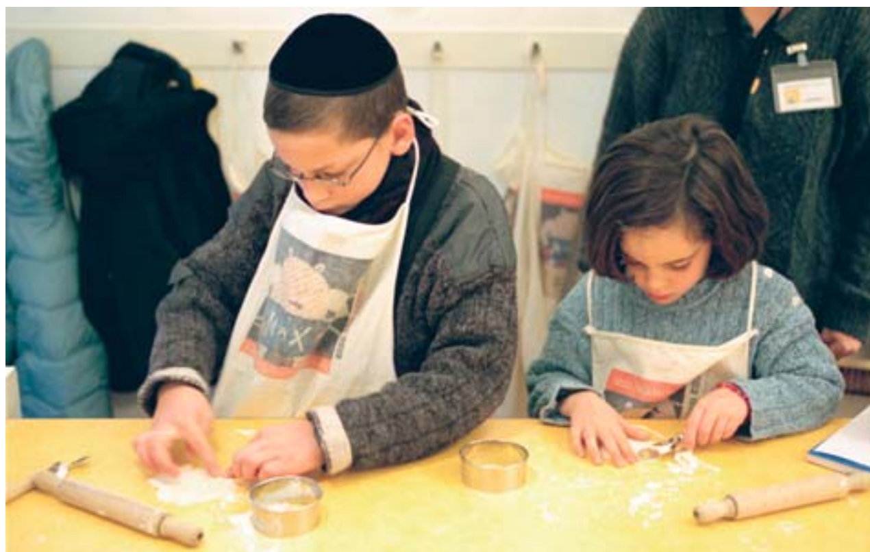
Matzes bakken in de keuken van het kindermuseum.