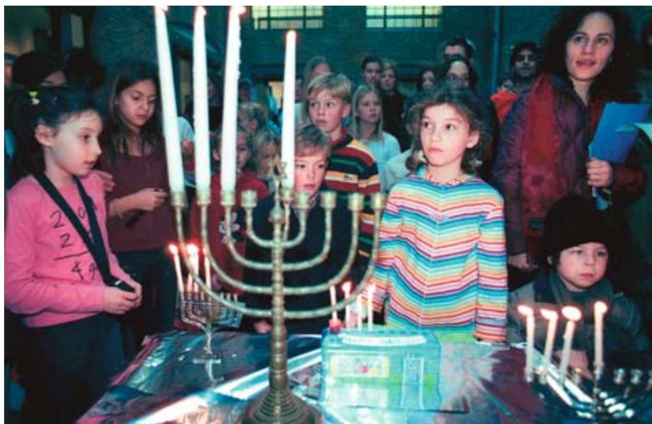
Kinderen ontsteken chanoekia in de Sjoelgasse.