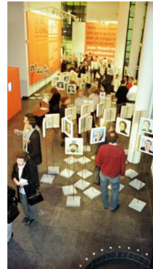
Geïnteresseerden kijken naar portretten tijdens de opening van Die ook...?!

De tentoonstelling Die ook...?! – het resultaat van een samenwerking tussen het Joods Museum in Wenen en Beth Hatefutsoth, The Nahum Goldmann Museum of Jewish Diaspora, Tel Aviv – was behalve in Oostenrijk en Israël eerder in Duitsland te zien. Voor het JHM bedachten Kossman.dejong exhibition architects een verrassende vormgeving. Meer dan 350 portretten stonden, ieder op een standaard verankerd in een stoeptegel, kriskras door elkaar in de Omloop en de Nieuwe Synagoge. De enige ordening van de schilderijen was een alfabetische op naam.