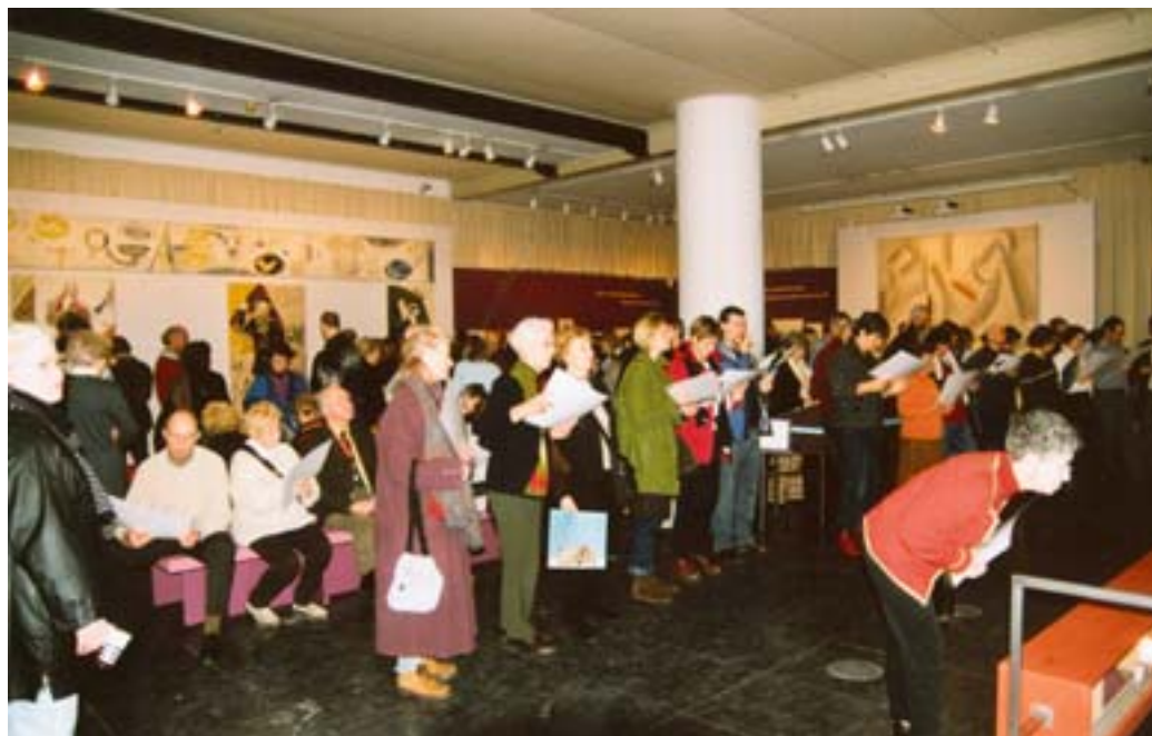
Januari bracht een recordaantal bezoekers voor Marc Chagall. Het Joods Theater