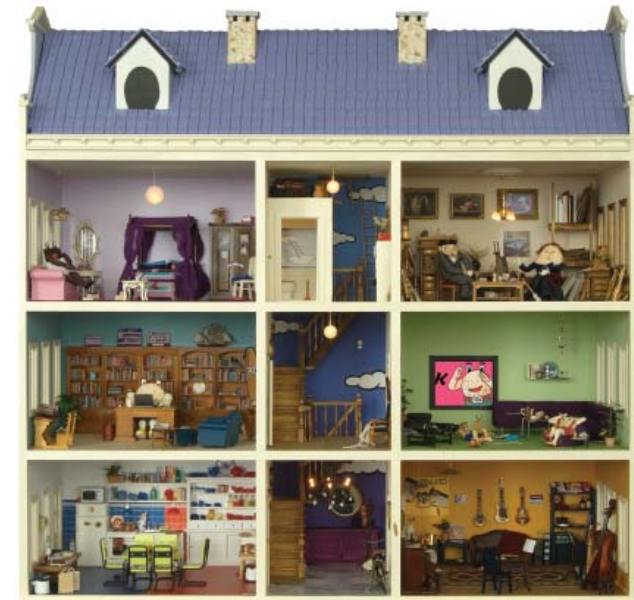
Het Huis van Max de Matze in het JHM Kindermuseum © Ram Katzir, mixed media, 2006

In het JHM Kindermuseum in de Obbene Sjoel gaan kinderen en volwassenen op bezoek in het huis van de joodse familie Hollander. Vader, moeder en hun drie kinderen beleven elk op een eigen manier hun joods-zijn. De familieleden zijn te zien in films die cineast Frans Weisz speciaal voor het museum maakte. In de verschillende kamers van het huis wordt de joodse cultuur belicht. Kinderen krijgen een beeld van de veelzijdigheid van het joodse leven en zullen merken dat er naast verschillen ook overeenkomsten zijn met hun eigen leefwijze en tradities. Het JHM Kindermuseum is speels en interactief vormgegeven. De 'gids zonder gist' Max de Matze, vervaardigd door beeldend