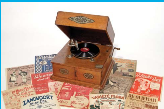
Grammofoon in eikenhouten kast, 1920-1940. Aankoop met steun van de Stichting Vrienden van het JHM