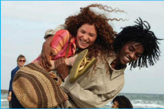
Still uit Va, vis et deviens (2005) van Radu Mihaileanu