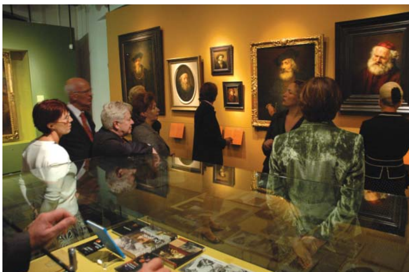
Rondleiding tijdens het Siemens-diner op 16 november 2006.