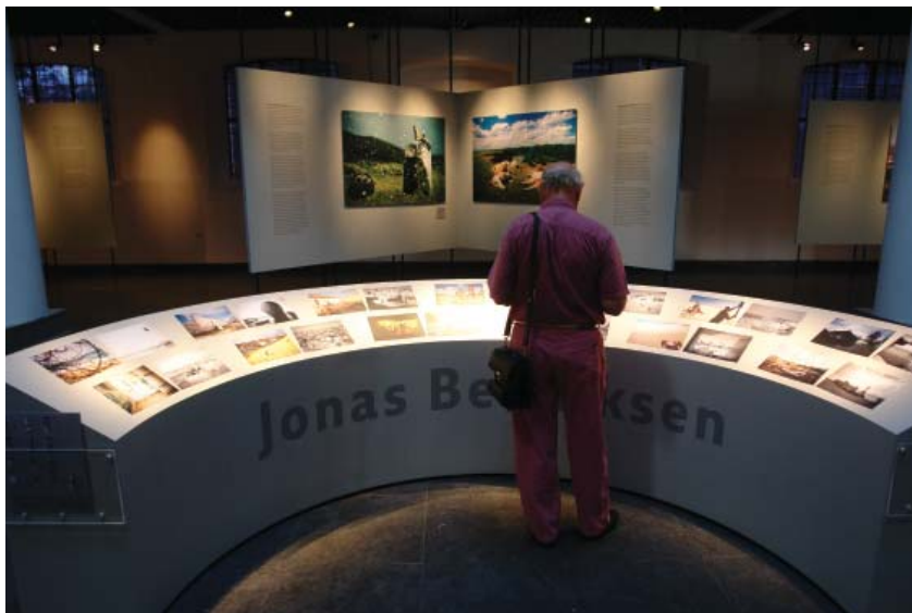
Bezoeker tijdens opening van Satellieten , 20 juli 2006.