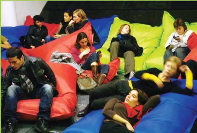
Bezoekers in het Museumcafé tijdens de Museumnacht op 4 november 2006.