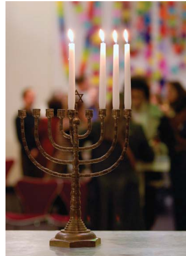
Open Dag Jhm Kindermuseum op 17 december 2006.

Veel leerlingen uit het voortgezet onderwijs volgden in 2006 het programma 'Joods?!', waarbij zij in de vaste opstelling van het Joods Historisch Museum een korte presentatie geven over een door henzelf gekozen onderwerp.