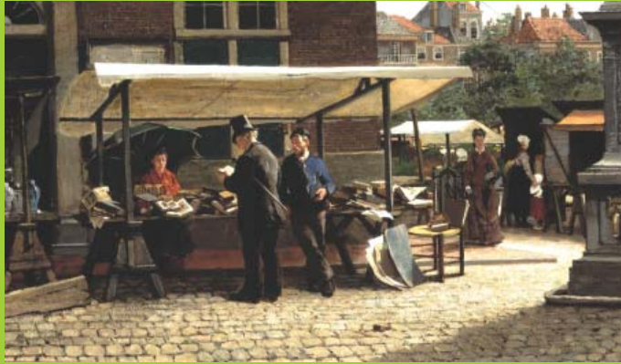
Theo Mesker, De boekenstal , 1877. Coll. jhm/schenking P. Wentges