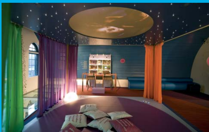
Slaapkamer Jhm Kindermuseum.