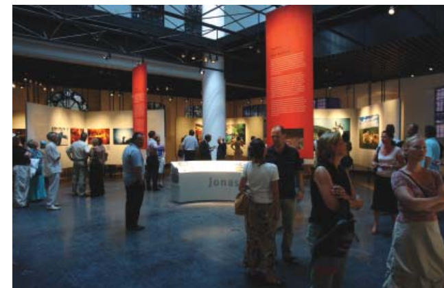
Opening van Satellieten , 20 juli 2006.

Het JHM nam wederom deel aan beurzen en culturele markten, zoals de Gemeentedag, Uitmarkt en Expat Fair. Een aantal initiatieven op het gebied van joodse cultuur verenigden zich in 'November, maand van de joodse cultuur'. Naast het JHM participeerden het Joods Film Festival, het Internationaal Joods Muziekfestival, het Joods Boekenweekend en de Stichting Joods Apeldoorn. Getracht wordt deze samenwerking in de komende jaren voort te zetten.