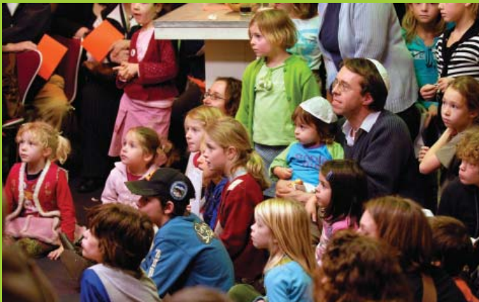
Open Dag Jhm Kindermuseum op 17 december 2006.